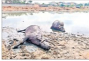
కృష్ణానదిలో కలుషిత నీరు తాగి మృతి చెందిన గేదెలు

ఈ ఘటనపై గ్రామస్థులు అగ్రహం వ్యక్తం చేస్తూ నిరసనకు దిగారు. నిర్లక్ష్యంగా వ్యవహరించిన